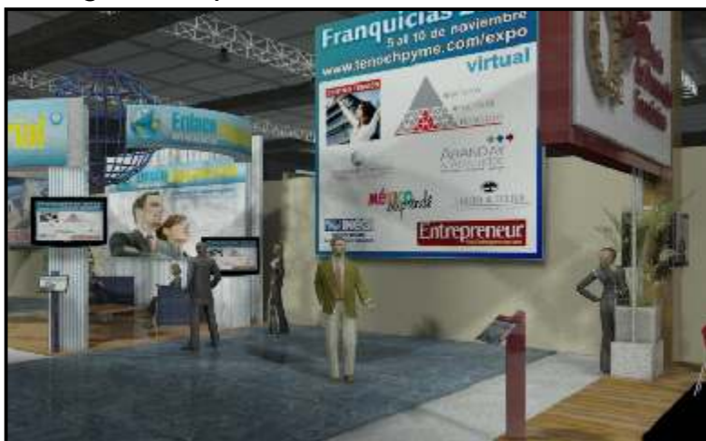
Imagen con patrocinadores

Su imagen clicable en todas las invitación, boletines y dentro del recinto virtual